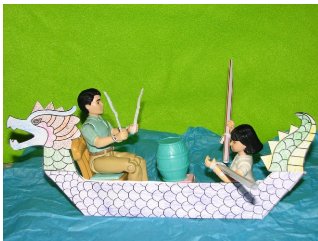
Loutkovou verzi našeho festivalu/ Puppet version of our festival:

Postavíme rovněž velkokapacitní tribunu pro milion diváků / A big grandstand with capacity for milion visitors!